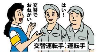
交替運転手の配置