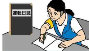
運転日誌の備付け