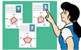
運転者の適性等の把握