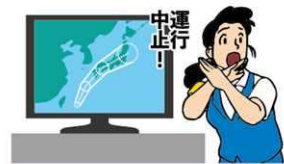
異常気象時等の措置