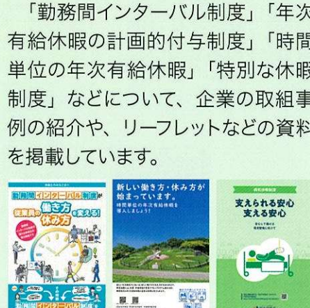
各制度に関するリーフレット(例)

「勤務間インターバル制度」「年次有給休暇の計画的付与制度」「時間単位の年次有給休暇」「特別な休暇制度」などについて、企業の取組事例の紹介や、リーフレットなどの資料を掲載しています。