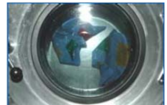
型崩れを起こさない 新たな洗浄方法

顧客情報を電子カルテ化し、顧客の生活環境に合った衣料品のメンテナンスサービスを提供するとともに、水洗いとドライの長所を併せ持つ洗浄方法の開発により、新規需要を開拓します。